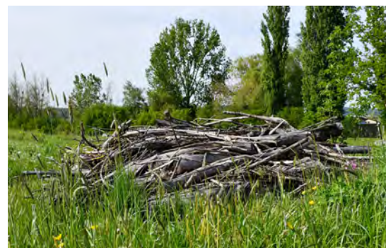
Mit Herz für die Natur: Igelnest im Fussballgolf

Igel in der Stadt oder im Dorf? Ja, das ist möglich: Wer seinen Garten igelfreundlich gestaltet, hilft nicht nur dem Igel. Unser beliebter Gartenbewohner (das kleine Stacheltier) frisst nicht nur Schädlinge, sondern auch viele andere Tiere wie Insekten, Vögel oder Siebenschläfer profitieren von mehr Natur im Garten. So wird der Garten zu einem lebendigen Lebensraum: für Tiere und Menschen gleichermaßen.