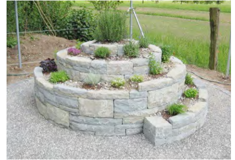
Kräuterspirale aus Sandstein

Zusätzlich speichern die Steine Wärme, was die Bildung von ätherischen Ölen in den Pflanzen in der Nacht fördert. Wichtig ist jedoch die regelmässige Pflege: Einige Kräuter sollten gezielt zurückgeschnitten und etwas eingedämmt